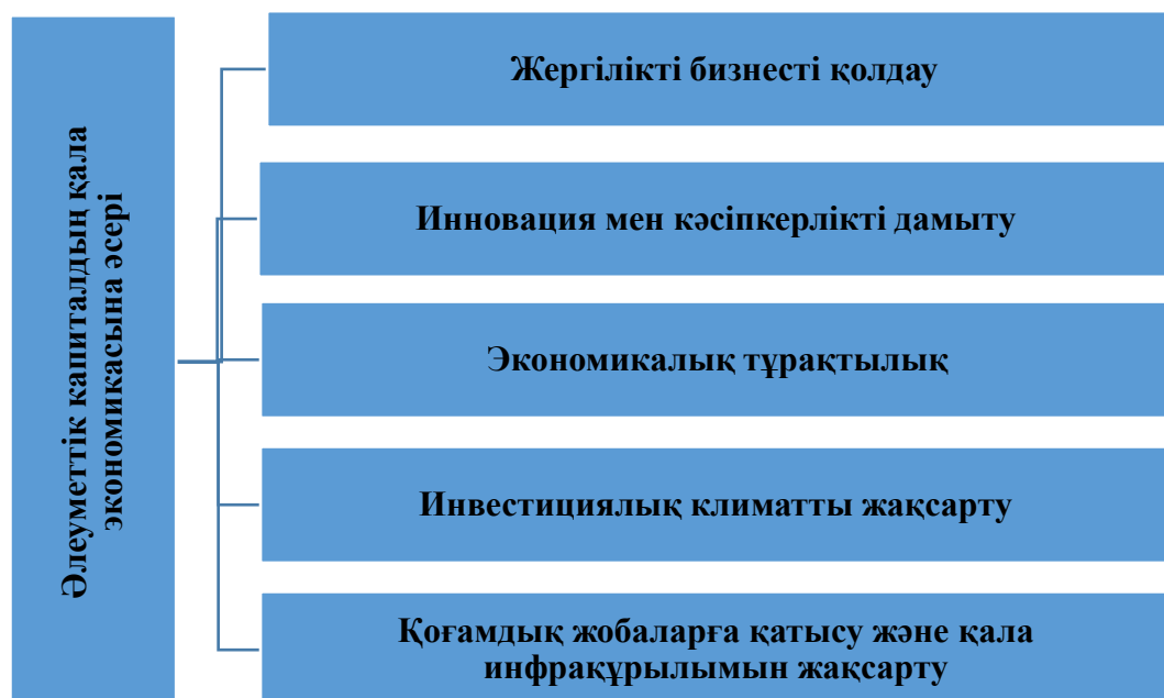
2-сурет. Әлеуметтік капиталдың қала экономикасына әсер етуінің бағыттары

сенімі жоғары болған жағдайда, олар өз аймағындағы өнімдерді сатып алуға көбірек бейім болады. Бұл экономикалық айналымды көбейтіп, жергілікті шағын және орта бизнестің дамуына ықпал етеді. Сонымен қатар, тұрғындар арасында қалыптасқан сенім бизнеске тәуекелдерді азайтуға мүмкіндік береді, өйткені тұрғындар жергілікті өндірушілерге қолдау көрсету арқылы жұмыс орындарын сақтайды және салық түсімдерін арттырады.