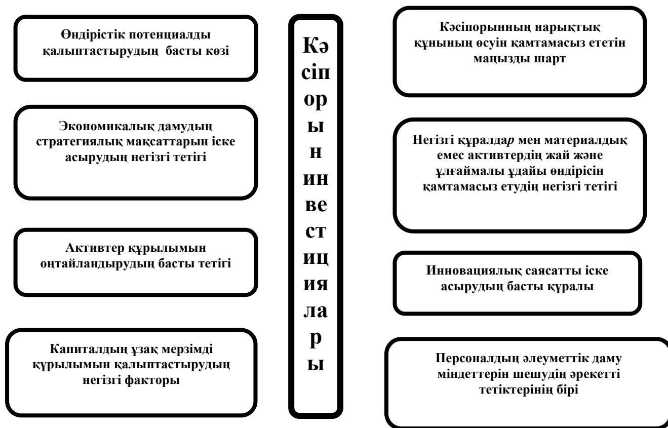
Сурет 2. Кәсіпорынның тиімді әрекет етуін қамтамасыз етудегі инвестициялардың ролі.

Инвестицияны тәжірибелік іске асыру кәсіпорынның инвестициялық қызметімен қамтамасыз етіледі. Ол шаруашылық қызметтің дербес түрінің бірі болып табылады.