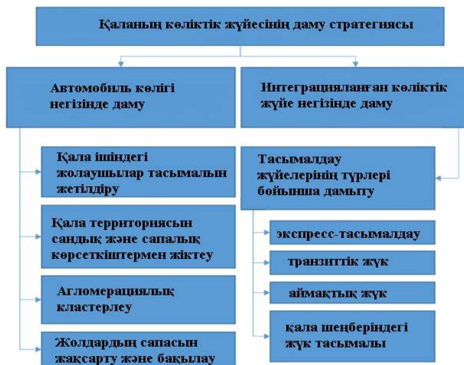
1-сурет. Қаланың көлік жүйесінің даму стратегиясы

Қаланың көліктік жүйесінің даму стратегиясы оның жалпы даму жоспарымен, инфрақұрылымдық ерекшеліктермен және басым көлік түріне байланысты болады (1-сурет).