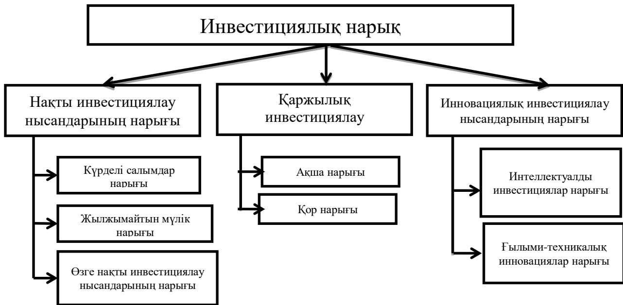
4- Сурет. Инвестициялық нарық құрылымы

Ресейлік инвестициялық нарықтың маңызды сегменттерінің бірі — күрделі инвестициялар нарығы-негізгі капиталға инвестицияларды қалыптастыру және орналастыру, оның ішінде жұмыс істеп тұрған кәсіпорындарды жаңа құрылысқа, кеңейтуге, қайта құруға және техникалық қайта жаратандыруға, Машиналар, жабдықтар сатып алуға және т. б. салымдар мәселелері бойынша экономикалық қатынастар саласы.