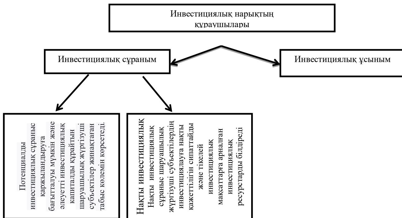
1 - Сурет. Инвестициялық нарық компоненттері

Инвестициялық нарықтың негізгі компоненттері инвестициялық сұраныс пен инвестициялық ұсыныс болып табылады, олардың өзара әрекеттесуі кезінде қалыпты инвестициялық белсенділік жағдайында салыстырмалы тепе-теңдікке қол жеткізіледі.